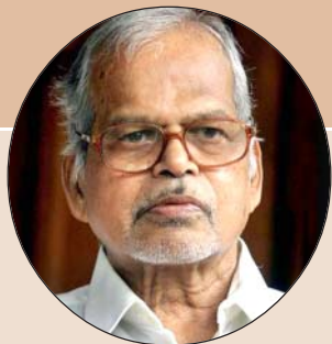
മലയാളത്തിന്റെ പ്രിയ കവി ആറ്റൂർ രവിവർമ്മക്ക് പ്രണാമം