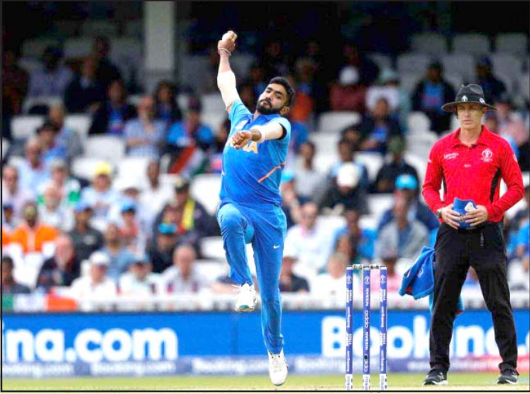
ലോക ഒന്നാം നമ്പർ ബൗളർ ബുറൂറയുടെ പ്രകടനം.

കൃത്യതയാർന്ന പന്തുകൾ മികച്ച സ്പീഡ് വേരിയേഷനിൽ എറിയാനുള്ള തന്റെ കഴിവ് ഒരിക്കൽ കൂടി തെളിയിച്ച ലോക ഒന്നാം നമ്പർ ബൗളർ ബുറൂറയുടെ പ്രകടനം ലോകകപ്പിലെ അതുല്യ മുഹൂർത്തങ്ങളായിരുന്നു.