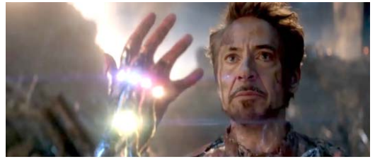
അവഞ്ചേഴ്സ്: എൻഡ് ഗെയിം ചിത്രത്തിൽ നിന്നും

* പച്ചമാങ്ങ: പ്രതാപ് പോത്തനും സോനയും പ്രധാന വേഷത്തിൽ എത്തുന്ന പച്ചമാങ്ങ പ്രദർശനത്തിന് ഒരുങ്ങുന്നു.