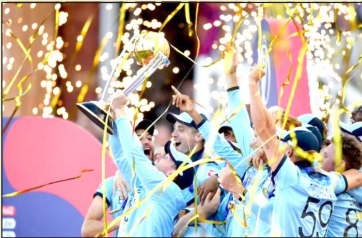
ഇംഗ്ലണ്ട് ടീം വിജയ ലഹരിയിൽ

ന്യൂസിലൻഡിനെതിരായ സെമിഫൈനൽ മത്സരത്തിൽ ഇന്ത്യയുടെ എം.എസ്.ധോണിയെ ഡയറക്ട് ഹിറ്റിലൂടെ റൺ ഔട്ടാക്കിയ മാർട്ടിൻ ഗുപ്റ്റിലും, ഇതേ മത്സരത്തിൽ ഉഗ്രൻ ഡൈവിലൂടെ ദിനേഷ് കാർത്തിക്കിനെ പുറത്താക്കിയ നിഷാമും, 16 റൺസ് എന്ന സൂപ്പർ ഓവർ വിജയലക്ഷ്യം പിന്തുടർന്ന ന്യൂസിലൻഡിന്റെ പോരാളികളായി.