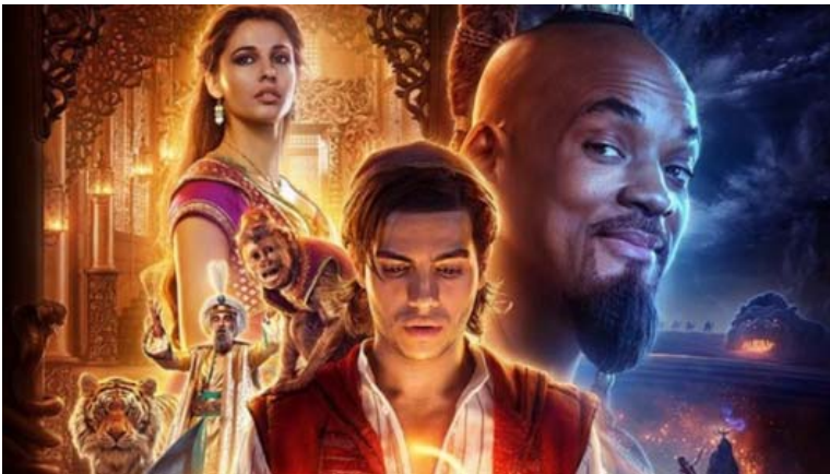
ഡിസ്നിയുടെ അലാദിൻ സിനിമയിൽനിന്നും.

സിന്റെ ബാനറിൽ സ്വപ്നേഷ് നായർ സംവിധാനം നിർവഹിച്ച ചിത്രമാണ് എടക്കാട് ബറ്റാലിയൻ. മുഖ്യകഥാപാത്രത്തെ ടൊവിനോ അവതരിപ്പിക്കുന്നു.