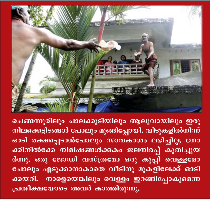
ചെങ്ങന്നൂരിലും ചാലക്കുടിയിലും ആലുവയിലും ഇരുനിലക്കെട്ടിടങ്ങൾ പോലും മുങ്ങിപ്പോയി. വീടുകളിൽനിന്ന് ഓടി രക്ഷപ്പെടാൻപോലും സാവകാശം ലഭിച്ചില്ല. നോക്കിനിൽക്കേ നിമിഷങ്ങൾക്കകം ജലനിരപ്പ് കുതിച്ചുയർന്നു. ഒരു ജോഡി വസ്ത്രമോ ഒരു കുപ്പി വെള്ളമോ പോലും എടുക്കാനാകാതെ വീടിനു മുകളിലേക്ക് ഓടിക്കയറി. നാളെയെങ്കിലും വെള്ളം ഇറങ്ങിപ്പോകുമെന്ന പ്രതീക്ഷയോടെ അവർ കാത്തിരുന്നു.

പേമാരി കലിതുള്ളി തോരാതെ പെയ്തതോടെ പുഴകൾ കവിഞ്ഞൊഴുകി. കേരളത്തിലെ 44 നദികളിലായുള്ള 43 ഡാമുകളും നിറഞ്ഞു.