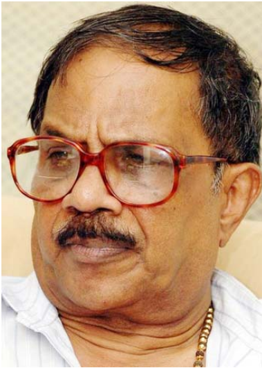
എം. ടി. വാസുദേവൻനായർ