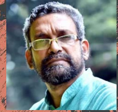
ചാക്കോ ഡി അന്തിക്കാട്